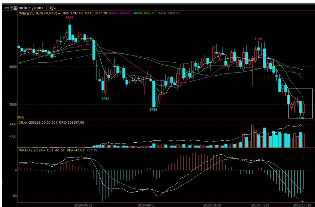
图 4 主力合约 jd2101 行情走势

本周五，鸡蛋主力合约 2101 日内反弹，收盘价 3803，涨幅+0.58%，成交量 263229 手，今日持仓量 169197 手，-15552 手（单边计算）。