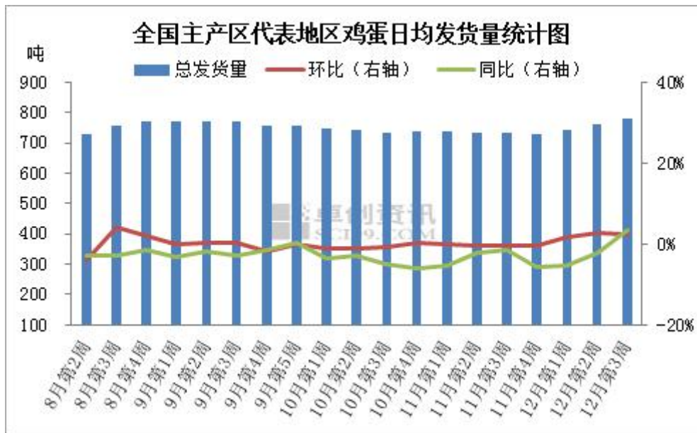
图 2 全国主产区代表地区鸡蛋日均发货量

本周产区代表市场发货量多数增加，整体流通好转，目前产地内销基本平稳，部分电商平台要货积极性依然较高，多地外销相对较快，后市看，随着圣诞、元旦活动的开启，终端走货依然稳中偏好，短期市场流通仍处于相对顺畅的状态，下周主产区发货量或继续稍增，中长线呈现缓慢增加态势。