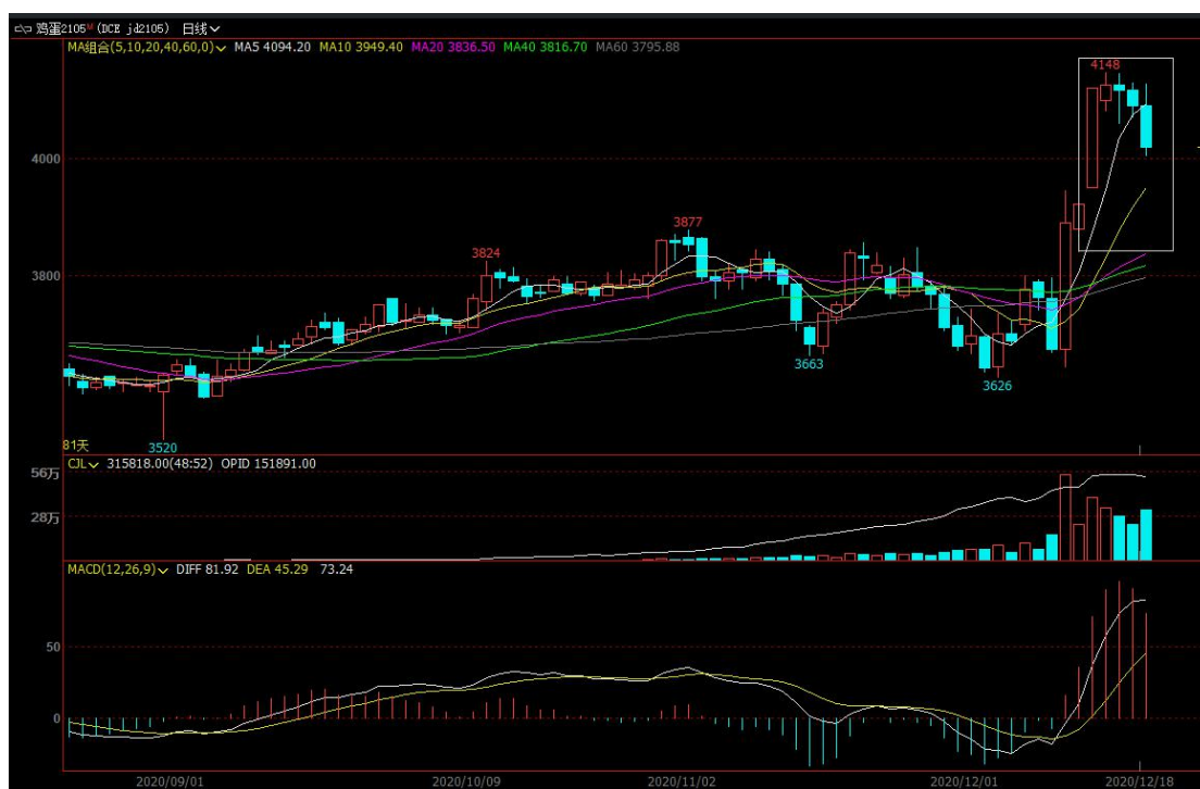
图 4 主力合约 jd2105 行情走势

本周五，鸡蛋主力合约 2105 高位回落，收盘价 4019，涨幅-1.88%，成交量 315818 手，今日持仓量 151891 手，-3405 手（单边计算）。