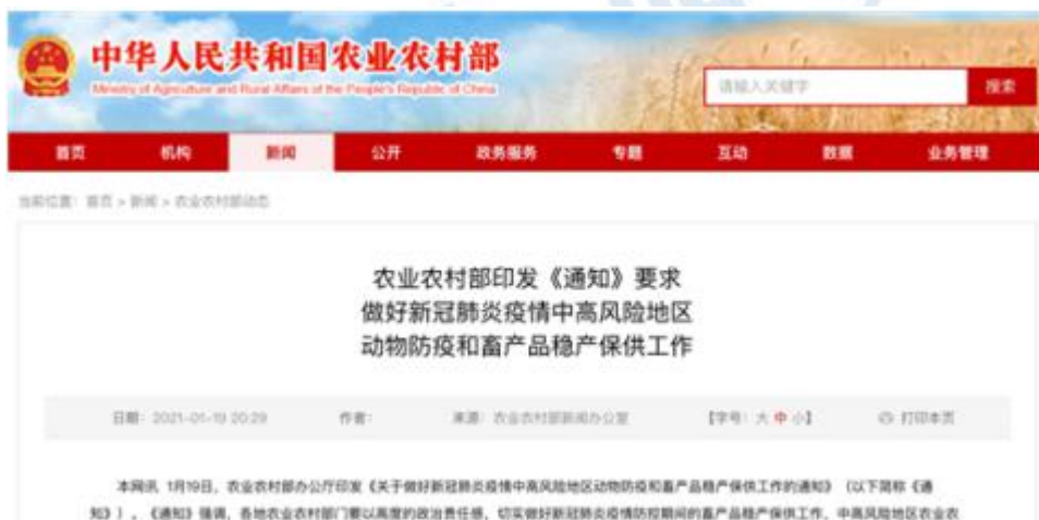
图3 农业农村部关于畜产品稳产保供工作的通知