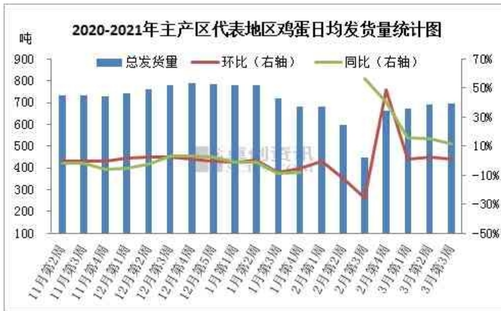
图 3 全国主产区代表地区鸡蛋日均发货量

本周主产区代表市场发货量多数稳定，西南、西北地区稍增，东北地区减少。目前市场处于平稳消化期，终端需求一般，各环节顺势采购，市场整体运行较平稳，波动不大。后市看，随着清明临近，局部走货或有好转，但目前市场供应仍相对充足，市场提振或有限，下周主产区发货量变动或仍不大，中长线看好。