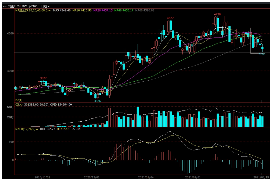
图 2 主力合约 jd2105 行情走势