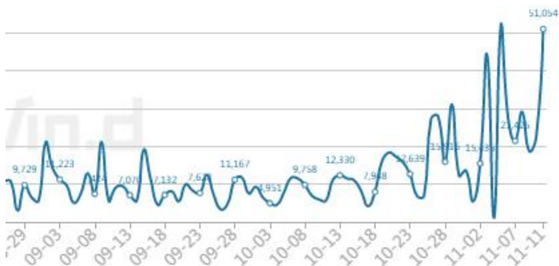
德国单日新增病例

德国新冠疫情形势持续恶化。11 日，德国疾控机构公布的新增确诊感染新冠病毒人数创下该国有疫情以来的新高，达 50196，死亡人数亦激增至 200 以上。为应对不断升级的疫情，德国联邦政府与各州将于 18 日紧急举行会议，商讨防疫政策。德国疾控机构罗伯特·科赫研究所当天公布的新增确诊人数和新增死亡人数分别为 50196 人、235 人，截至当天累计确诊 4894250 人、死亡 97198 人。其中，该国官方用于监测疫情严重程度的“平均每 10 万人七日累计新增确诊病例数”（发病率指数）当天升至 249.1，为疫情以来新高。需接受 ICU 重症监护治疗的患者新增 52 人，总数达 2739 人。截至当天，德国累计接种 1.141 亿剂次新冠疫苗，共有 5600 万人已完全接种，占该国总人口数的 67.3%。