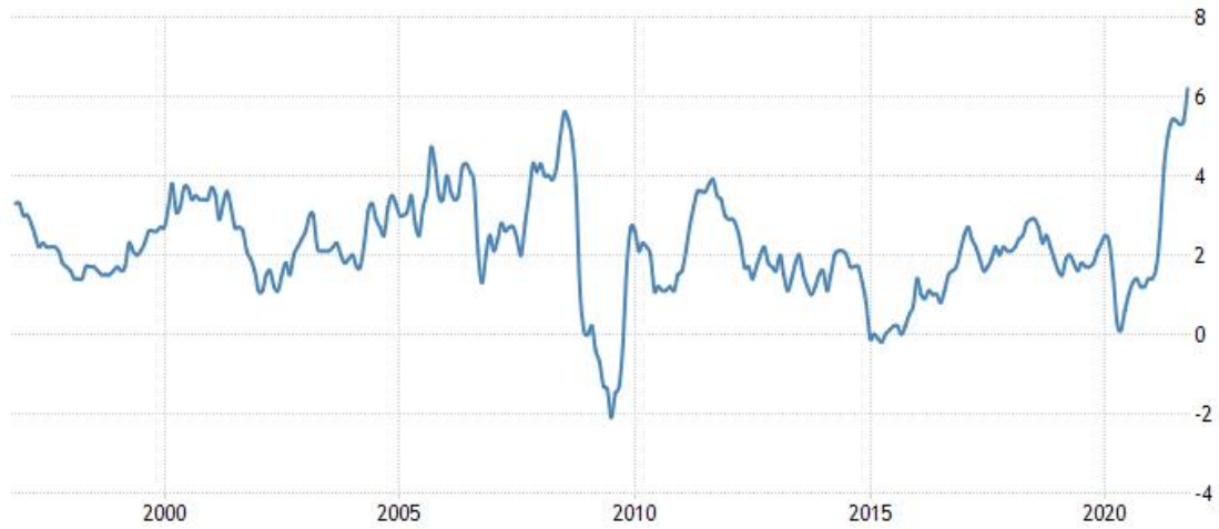
美国 CPI 数据 (%)

预期。数据显示，剔除波动较大的食品和能源价格后，美国 10 月核心 CPI 环比上涨 0.6%，同比上涨 4.6%，同样高于市场普遍预期。