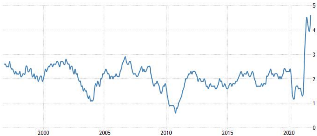
美国核心 CPI 数据 (%)