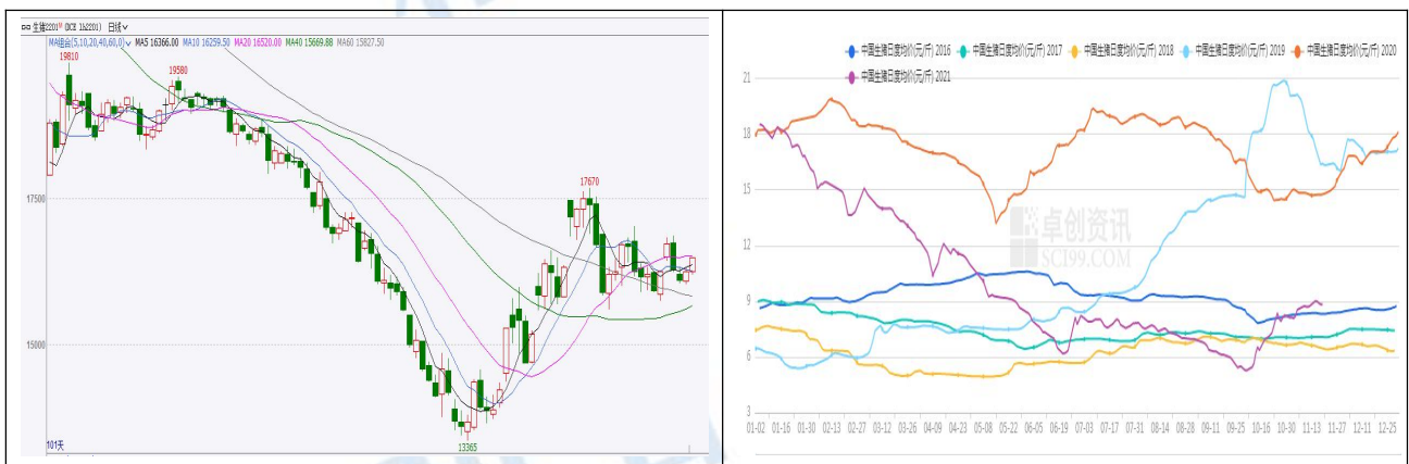
图 1 生猪期货及现货价格

生猪期价本周震荡运行，整体较上周小幅上涨。截止周五收盘，主力 LH2201 合约收盘价 16490 元/吨，较上周五上涨 240 元/吨，涨幅 1.48%。现货价格继续小幅上涨，截止本周五，全国生猪外三元现货均价 17.68 元/公斤，较上周五上涨 0.18 元/公斤，涨幅 1.03%。