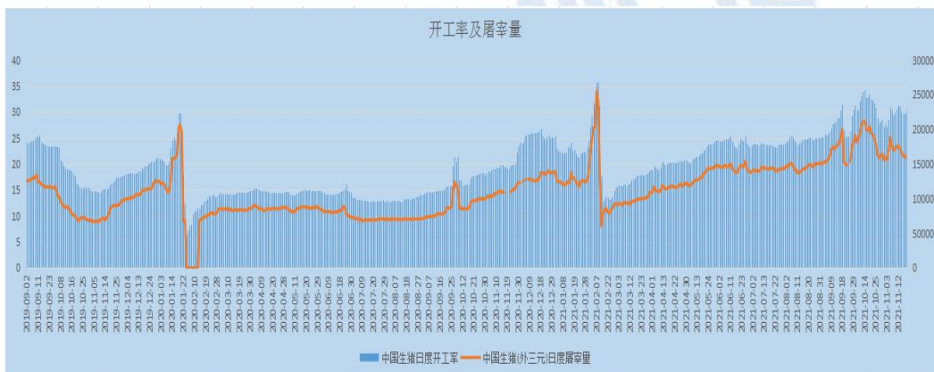
图 3 生猪屠宰及开工情况

从全国生猪屠宰量和开工率来看，截止 11 月 19 日，全国生猪屠宰日度开工率为 30.4%，较上周下降 0.98%。日度屠宰量为 159506 头，较上周减少 16907 头，降幅 9.58%。