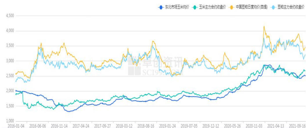
图4 玉米和豆粕期现货价格

从饲料原料来看，玉米期价回调三日后，从本周二再次走强，截止11月19日，主力合约收于2705元/吨，较上周上涨42元/吨，涨幅1.58%。最新数据显示，前10个月猪饲料产量破亿吨，10月份猪饲料产量1091万吨环比下降0.7%。2021年10月，全国工业饲料总产量2520万吨，环比下降4.1%，同比增长0.2%。从品种看，猪饲料产量1091万吨，环比下降0.7%，同比增长8.8%。2021年1—10月，全国工业饲料总产量24360万吨，同比增长14.9%。其中，猪饲料产量10599万吨，同比增长49.5%。截止11月19日，育肥猪配合饲料均价3.58元/公斤，与上周五基本持平。较10月底上涨0.04元/公斤。