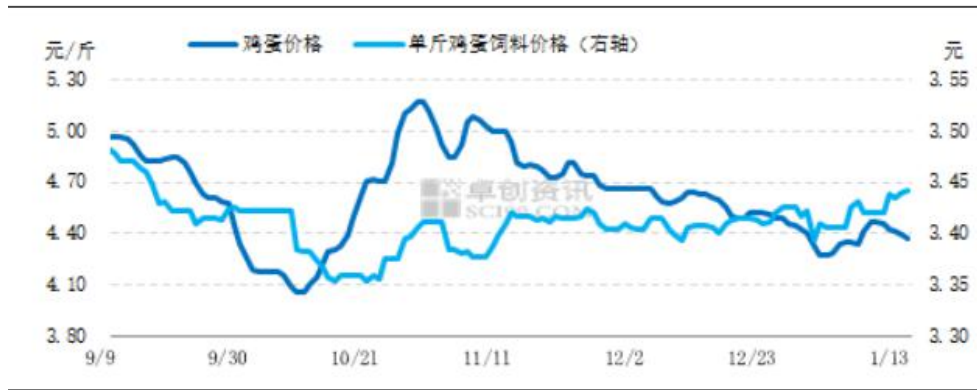
图8 鸡蛋价格与单斤鸡蛋饲料成本走势图