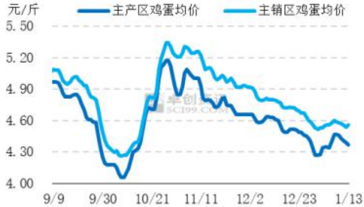
图2 全国主产区鸡蛋价格走势