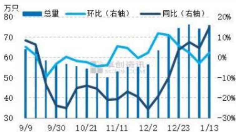
图5 全国代表市场淘汰鸡周度出栏量统计图

本周淘汰鸡出栏量环比增加，据卓创对 22 个代表市场的淘汰鸡出栏量统计，总出栏量 75.95 万只，环比涨幅 2.46%，同比涨幅 14.94%。养殖单位继续积极淘汰老鸡，淘汰鸡出栏量多数小幅增加，少数暂时平稳。山东、湖北等地养殖单位多不看好后期市场，因此出栏量增加，其他市场虽积极淘汰老鸡，但适龄老鸡有限。近期养殖单位普遍有淘汰适龄老鸡的计划，因此后期出栏量难以减少。