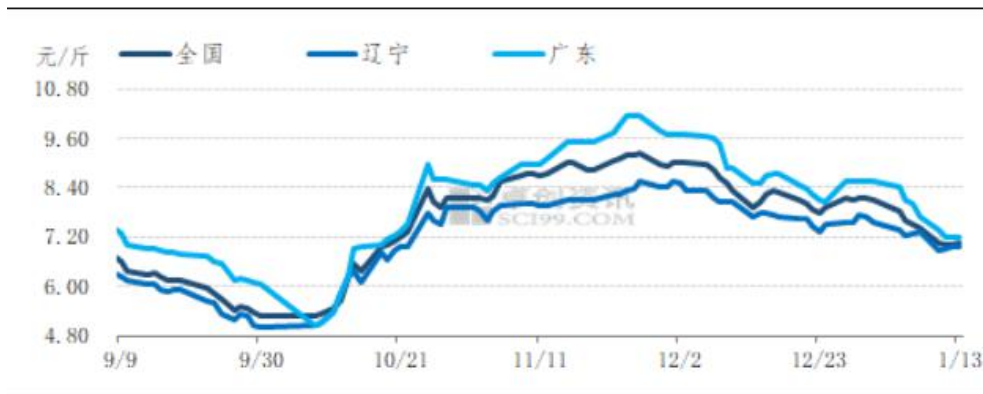
图9 全国生猪均价趋势图

本周国内生猪价格呈现先降后翘尾走势。周内外三元出栏均价 17.11 元/斤，较上周跌幅 8.38%。后半周猪价虽略有翘尾，但主线依旧以降为主，且周内降幅较大，原因有以下两点。从供应端来看，集团猪场担忧春节之后猪价下滑，多选择于本月加量走货，市场标猪充裕，食企收购难度降低。从消费端来看，南方腌腊接近尾声，同时北方需求无明显好转，白条消化速度放缓，供需略显失衡。