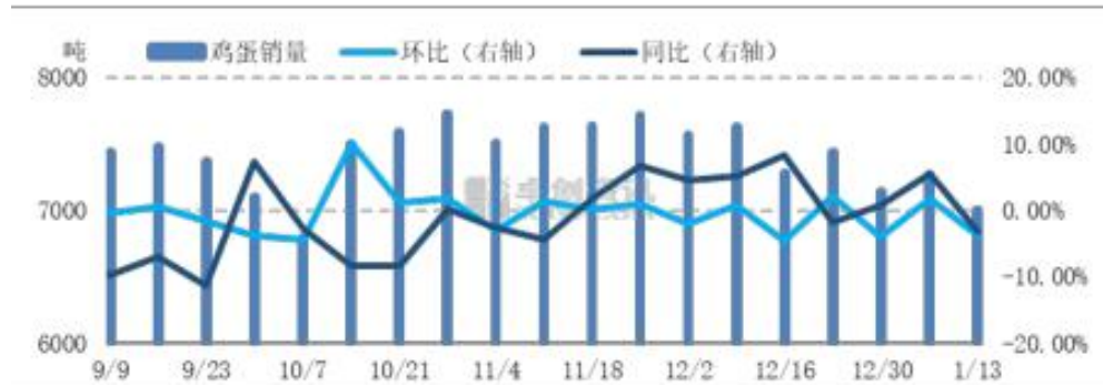
图7 全国代表城市销量统计图

产区蛋价上涨乏力，且学校、工厂陆续放假，市场需求逐渐减弱，经销商为规避风险，多顺势购销，维持低位库存，销区市场鸡蛋销量有所下降。据卓创资讯对代表市场进行数据统计，本周总计鸡蛋销量为 7008.60 吨，环比减幅 3.75%，同比减幅 3.11%。