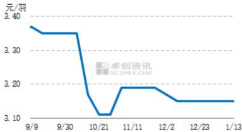
图3 中国市场蛋鸡苗周度价走势图

本周鸡苗价格走稳,均价为 3.15 元/羽,环比持平,主流报价 3.00-3.30 元/羽,少数高价 3.50-4.00 元/羽,部分低价 2.50- 2.80 元/羽。鸡蛋价格上涨动力不足,加之个别地区市场流通受限,目前养殖单位谨慎补栏为主,部分养殖单位对春节后鸡苗需求略有提升。中小企业随订随孵为主,部分企业鸡苗订单排至 3 月份,种蛋利用率多在 50%-80%,少数在 100%,部分低于 50%。