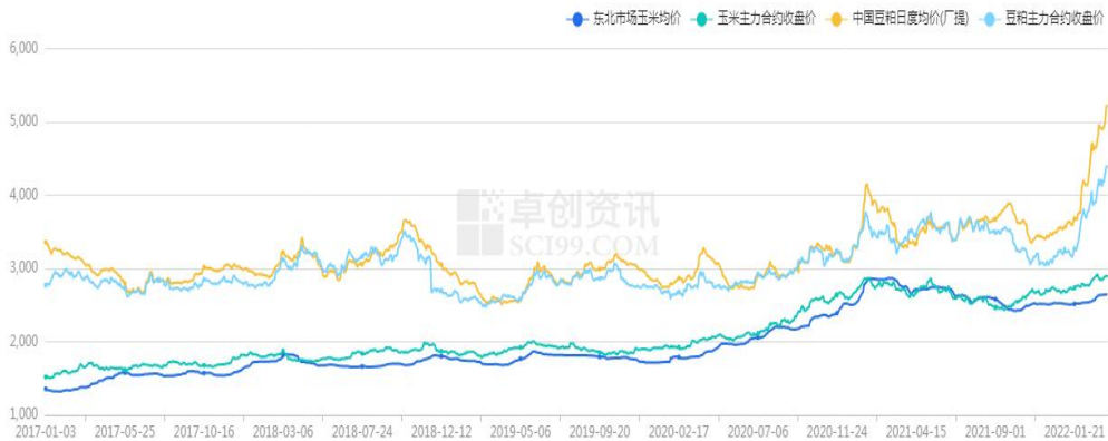
图 4 玉米和豆粕期现货价格