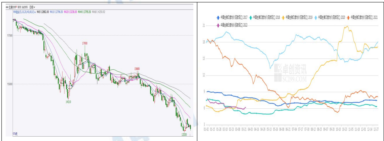
图 1 生猪期货及现货价格

本周生猪现货价格涨幅较大，期货价格也有企稳迹象。截止周五收盘，主力 LH2205 合约收盘价 12705 元/吨，较上周五上涨 55 元/吨，涨幅 0.43%。截止本周五，全国生猪外三元现货均价 12.3 元/公斤，较上周五上涨 0.62 元/公斤，涨幅 5.31%。