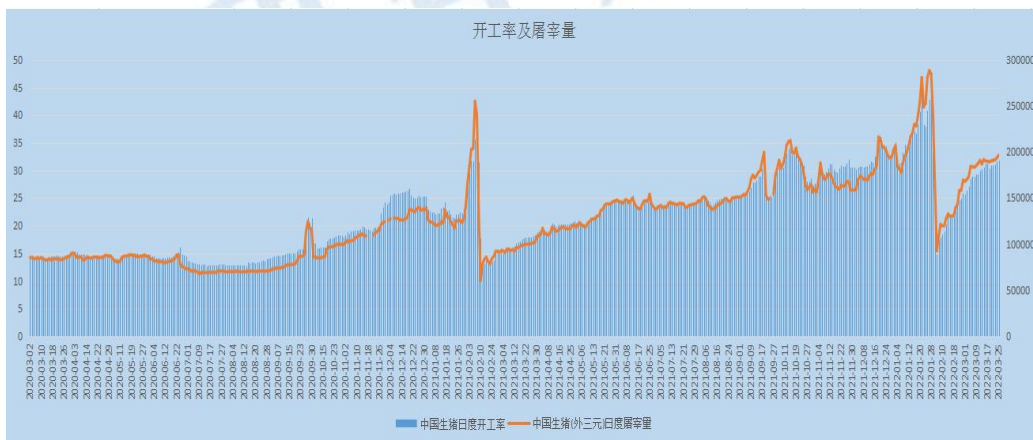
图 3 生猪屠宰及开工情况

本周，全国生猪屠宰量和开工率环比上周继续增加。截止 3 月 25 日，全国生猪屠宰日度开工率为 31.87%，较上周同期增加 1.42%。日度屠宰量为 196591 头，较上周同期增加 7380 头，增幅 3.9%。但目前时值 3 月淡季，春暖花开，气温回暖，居民对猪肉消费需求还在下降，加上疫情零星复发，防控力度加大，餐饮行业整体受损，猪肉消费形势也不宜过度乐观。