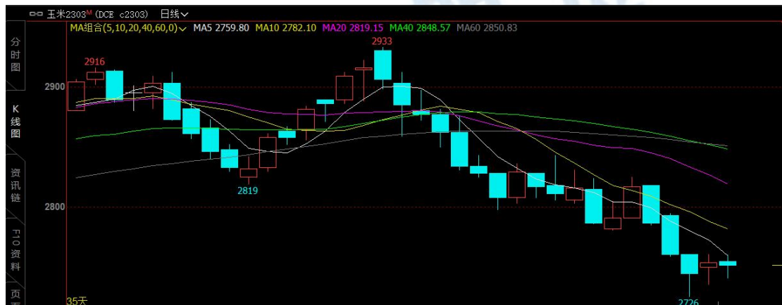
图 1

本周玉米盘面价格呈震荡走势。本周玉米主力合约 2303 最低收盘价为 2745 元/吨，最高收盘价为 2785 元/吨，周跌幅 2.31%。