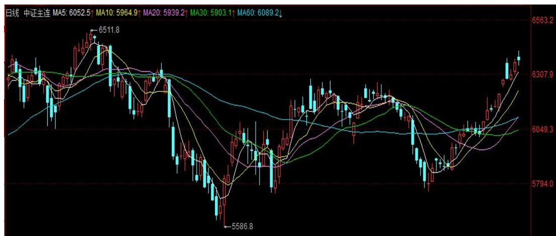
图 3 IC 期货价格