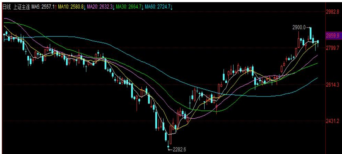
图 2 IH 期货价格