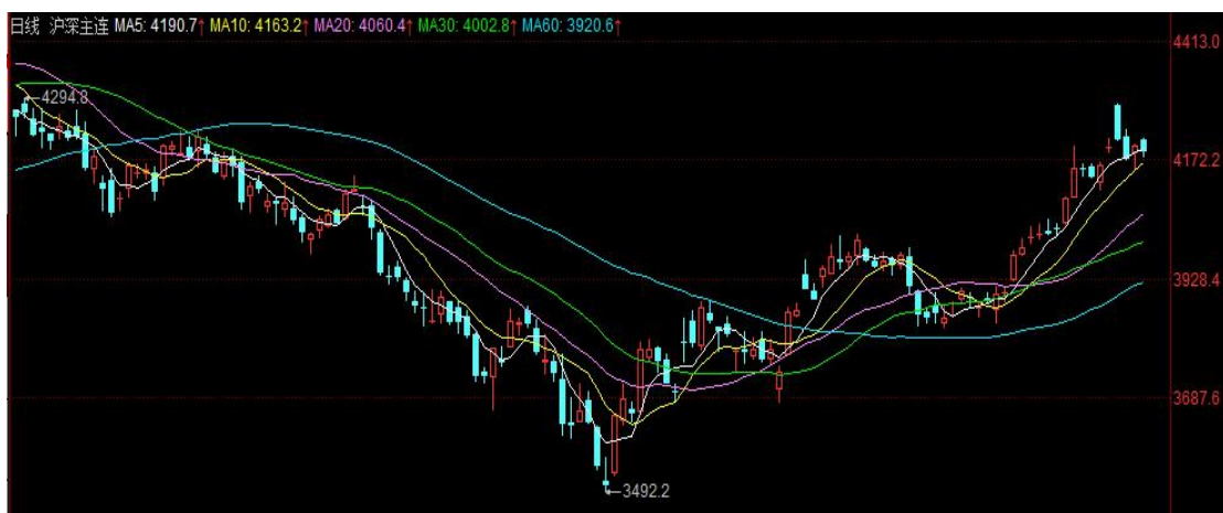
图 1 IF 期货价格

本月股指全线上涨。综合来看，沪深 300 指数上涨 7.37%至 4156.86 点，IF 主力合约上涨 7.48%至 4169.6 点；上证 50 指数上涨 6.55%至 2807.95 点，IH 主力合约上涨 6.54%至 2819.6 点；中证 500 指数上涨 7.24%至 6289.15 点，IC 主力合约上涨 7.348%至 6302.0 点。中证 1000 指数上涨 8.34%至 6286.81 点，IM 主力合约上涨 8.47%至 6818.0 点。