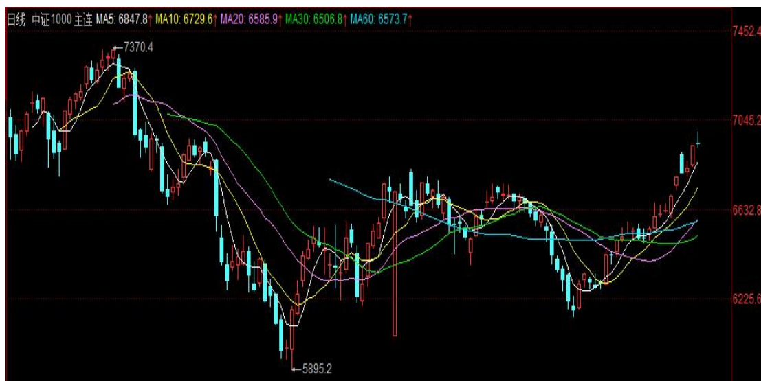
图 4 IM 期货价格