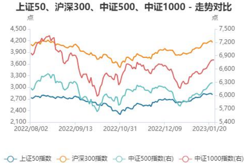
图 5 相关指数走势