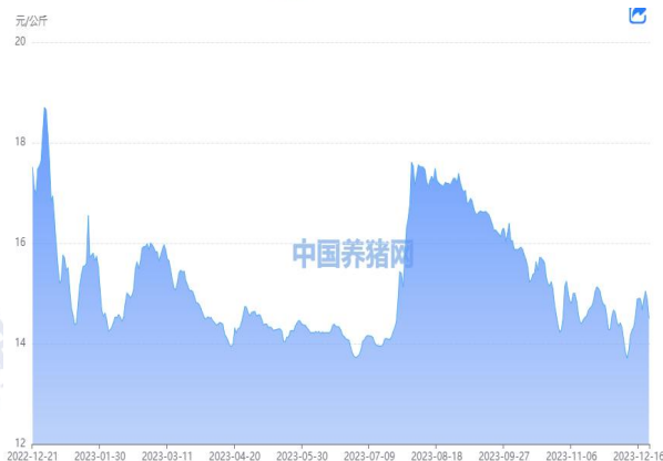
图 1：外三元生猪价格