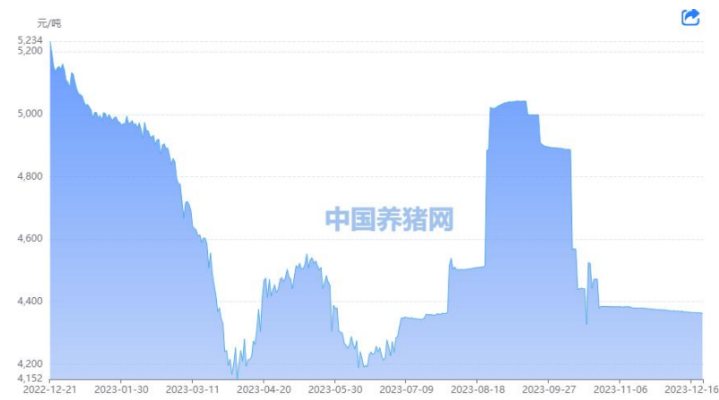
图 6: 豆粕市场价格

南美天气仍存较大不确定性，进口大豆和菜籽大量到港压制价格，豆油开机有所回升，下游生猪养殖持续亏损，生猪出栏量加快，能繁母猪存栏降幅明显扩大的背景下，下游需求持续疲软，采购情绪难以修复，豆粕价格稳弱运行。据中国养猪网数据显示，12月22日豆粕价格为4363元/吨，较上周五下跌3元/吨。