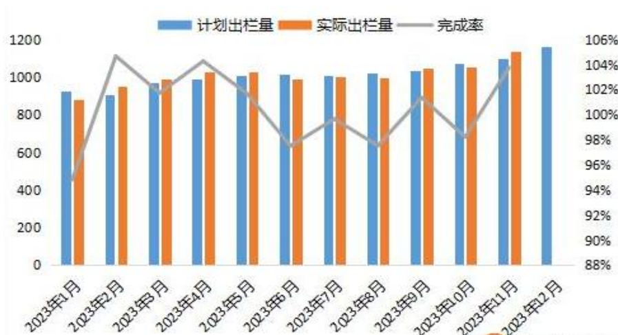
图 3：2023 年养殖企业生猪出栏量情况

11 月生猪出栏量超计划 3.77% 完成，规模猪企在年底冲量压力下加快出栏节奏，12 月出栏计划出栏量达到 1163.75 万头，较 11 月实际出栏增长 2.07%，持续创下年内最高水平。根据数据推算，仔猪出栏也为市场带来压力，今年 4-9 月全国新生仔猪量同比增长 5.9%，这些仔猪将在未来 6 个月内陆续出栏。生猪去产能依旧缓慢，10 月能繁母猪存栏量 4210 万头，环比下滑 0.7%，但当前生猪存栏依旧高于 4100 万头的正常保有量。