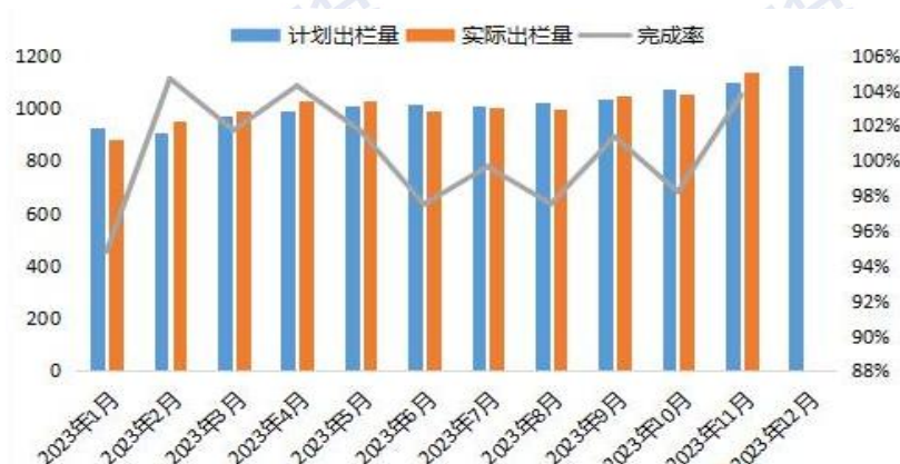
图 3：2023 年养殖企业生猪出栏量情况

11 月生猪出栏量超计划 3.77%完成，规模猪企在年底冲量压力下加快出栏节奏，12 月出栏计划出栏量达到 1163.75 万头，较 11 月实际出栏增长 2.07%，持续创下年内最高水平。根据数据推算，仔猪出栏也为市场带来压力，今年 4-9 月全国新生仔猪量同比增长 5.9%，这些仔猪将在未来 6 个月内陆续出栏。生猪去产能依旧缓慢，11 月能繁母猪存栏量 4158 万头，环比下滑 52 万头，但当前生猪存栏依旧高于 4100 万头的正常保有量。11 月份，全国生猪出栏环比增长 4.2%、同比增长 8.9%。