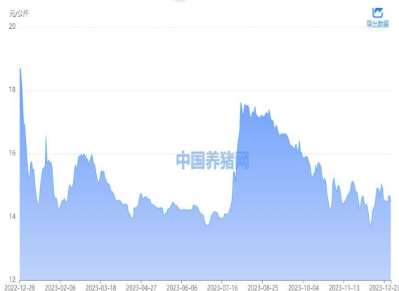
图 1：外三元生猪价格