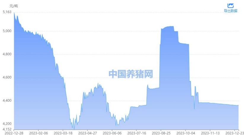
图 6: 豆粕市场价格

近期巴西大豆产区降雨增加，对前期干旱有所缓解。进口大豆和菜籽大量到港压制价格，豆油开机总体处于偏低水平，下游生猪养殖持续亏损，生猪出栏量加快，能繁母猪存栏降幅明显扩大的背景下，下游需求持续疲软，采购情绪难以修复，豆粕价格稳弱运行。据中国养猪网数据显示，12月29日豆粕价格为4362元/吨，较上周五下跌1元/吨。