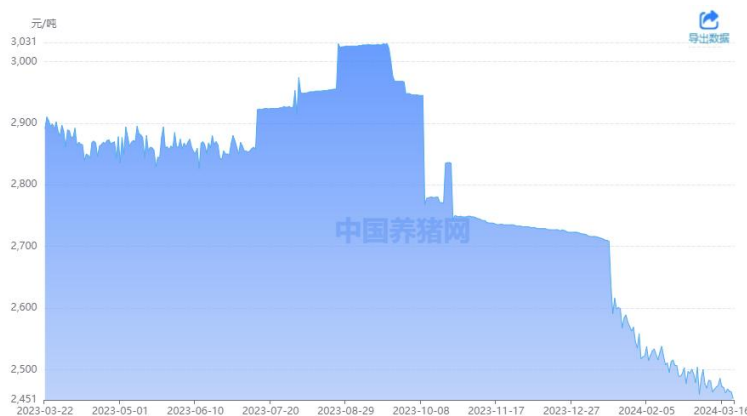
图 5: 玉米市场价格