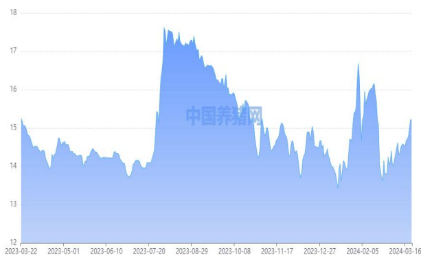
图 1：外三元生猪价格