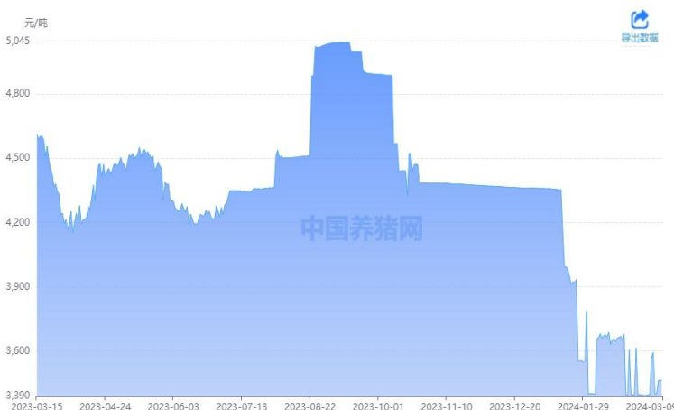
图 6: 豆粕市场价格

近期进口大豆到港量偏低导致国内部分油厂出现减产停机现象，压榨量有所下降后豆粕产量降低，但饲料养殖企业库存偏低加之豆粕价格持续反弹后提货意愿增强，豆粕库存大幅回落，叠加美盘大豆反弹带动进口大豆成本攀升，增强油厂的挺粕动力，豆粕承接美盘大豆继续偏强上行走势。据中国养猪网数据显示，3月22日豆粕价格为3470元/吨，较上周五上涨72元/吨。