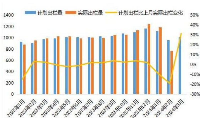
图 3：养殖企业生猪出栏量情况

2024 年 2 月生猪实际出栏量达到 770.41 万头，出栏量完成 80.17%。3 月国内养殖企业计划出栏量为 1011.96 万头，较 2 月实际出栏大增 31.35%。或许 2 月末完成的量有一部分将在 3 月出栏，虽然 3 月出栏总量要多于 2 月，但从日均来看，2 月出栏天数仅为 21 天，日均在 36.7 万头，3 月出栏日均在 32.6 万头，可见 3 月出栏压力较 2 月缩量。